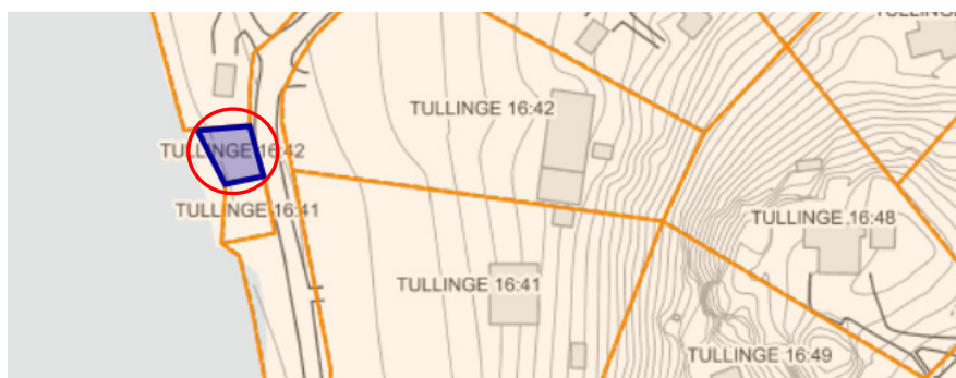
Bild 3. Karta med aktuellt område för trädäck och staket inom röd ring.

Förvaltningen har studerat flygfoton mellan 1960 – 2017. Foton från 1975 och 2008 visar att det fanns en brygga utanför strandtomten Tullinge16:42 dock ingen trädäck eller staket syns (se nedan).