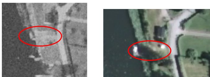
Bild 4 visar flygfoto från 1975 till vänster och flygfoto från 2008 till höger med fastigheten inringad i rött.

Förvaltningen har studerat flygfoton mellan 1960 – 2017. Foton från 1975 och 2008 visar att det fanns en brygga utanför strandtomten Tullinge16:42 dock ingen trädäck eller staket syns (se nedan).