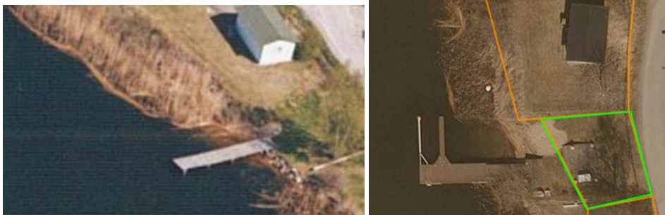
Bild 5 visar flygfoto från 1994 och från 2017.

Flygfoton från 1994 respektive 2017 (nedan) visar att bryggan har en annan utformning idag, y-bommar och trädäck har byggts till.