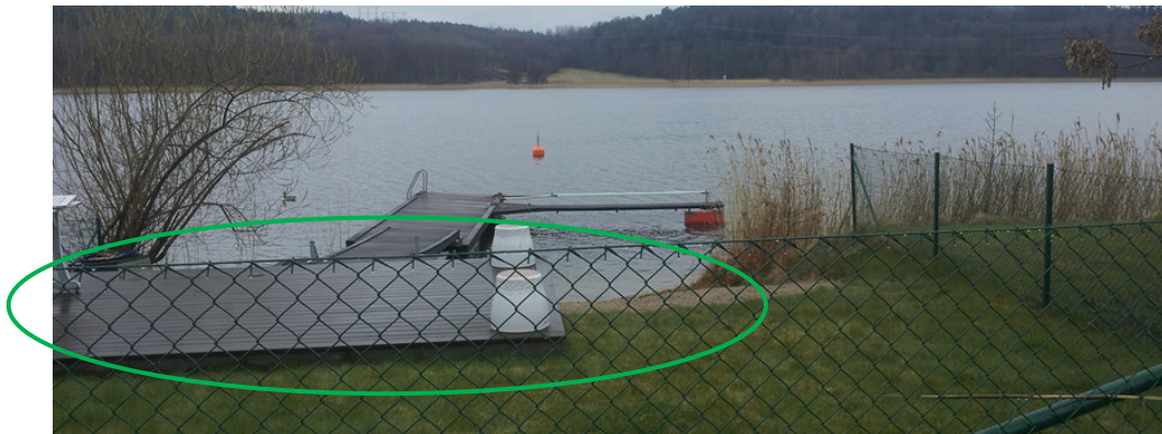
Bild 6 visar aktuell brygga med trädäck och staket tillhörande strandtomt.

Förvaltningen har beslutat att bevilja strandskyddsdispens för den tillkommande y-bommen i ärende dnr SBN 2019-607. Länsstyrelsen har beslutat att inte överpröva nämndens beslut.