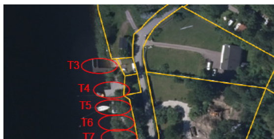
Bild 2. Flygfoto från 2015 med Mark- och exploateringskontorets numrering av bryggor vid Tullingesjöns östra sida. Aktuell brygga benämnd T3 som trädäcket är vidbyggd vid.

Förvaltningen har i samband med ansökan om strandskyddsdispens i efterhand för y-bom, tillbyggnad på brygga, gjort utredning i ärende dnr SBN 2019-607. Utredningen handlade om vilka åtgärder som varit utförda på fastigheten innan år 1975.