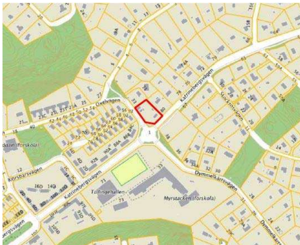
Översiktbild med markerat planområde.