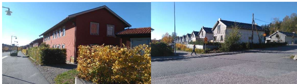
Vy mot moderna bostadshus på andra sidan av Oxelvägen.

Stads-och landskapsbilden förväntas inte förändras nämnvärt. Planområdet ligger i en lågpunkt. I närområdet i norr finns flera höjdryggar vilka förstärker stads-och landskapsbilden.