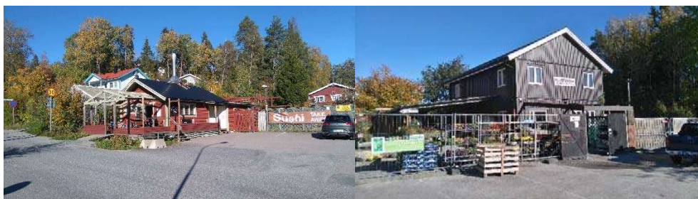
Vy från väster mot restaurang och Plantshopen.

Fastigheten Tullinge 17:129 är en bebyggd fastighet, som huvudsakligen nyttjas för ett trädgårdsmästeri med uthus, planteringar, försäljningslokal och för restaurangändamål. Vid västra gränsen av fastigheten finns en parkeringsplats för verksamheternas besökare och personal. På två sidor inramas tomten av låga buskar och lövträd. På de andra sidorna gränsar den till lokala vägar och en vändplan. Hela tomten sluttar mot söder.