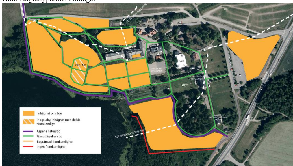
Bild: Hågelbyparken efter dispensansökan