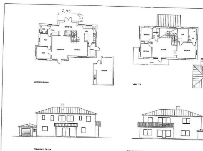
Bild 6 underlag för slutbesked dnr SBN 2016-576 och tillsynsärende – Redovisar inga murar.