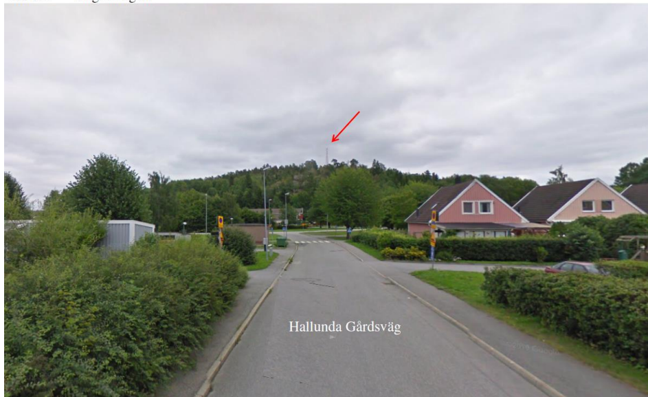
Bild tagen från Hallunda Gårdsväg